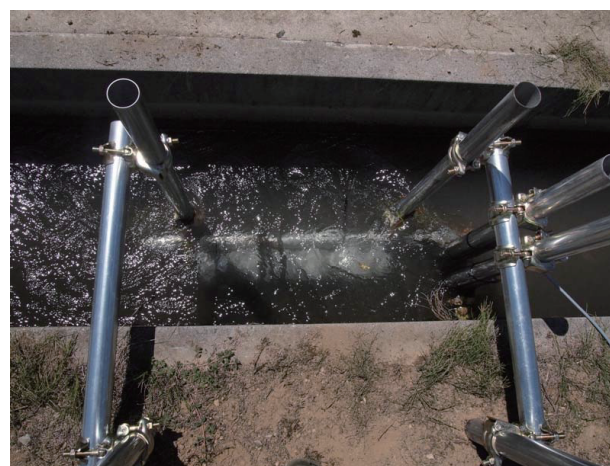
安積疎水から引水している用水路への機器の設置状況