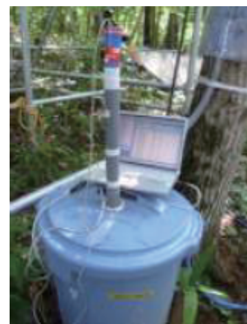
山木屋小学校：樹幹流タンク