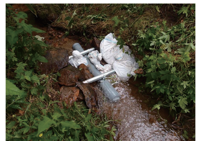
疣石山：浮遊砂サンプラー