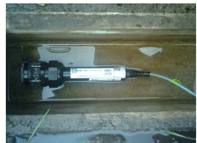
清掃・メンテナンス後の流出部U字構内