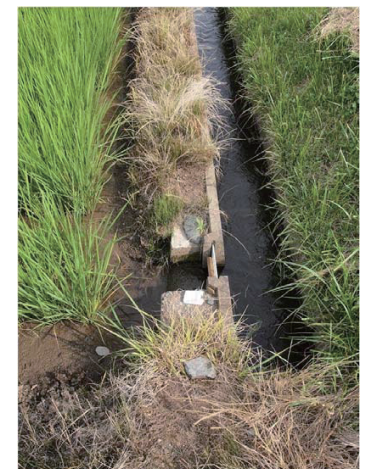
相馬サイト：取水口