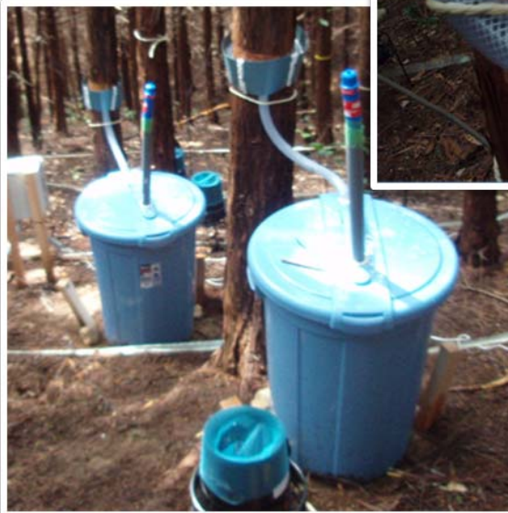
写真2 樹幹流のシステム