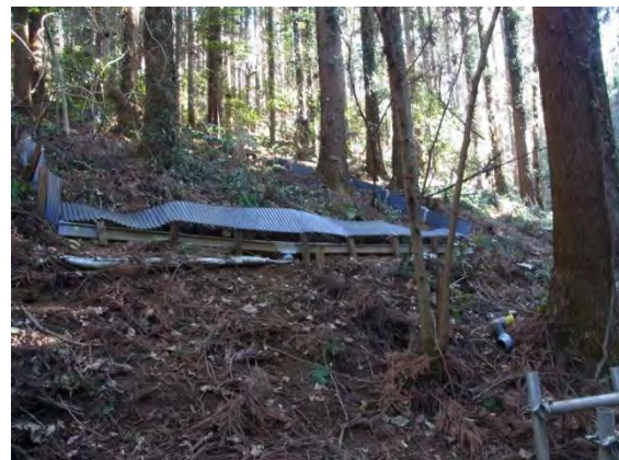
斜面プロット撤去後 (タンク、三角堰、塩ビパイプ、ロガーのみ撤去)