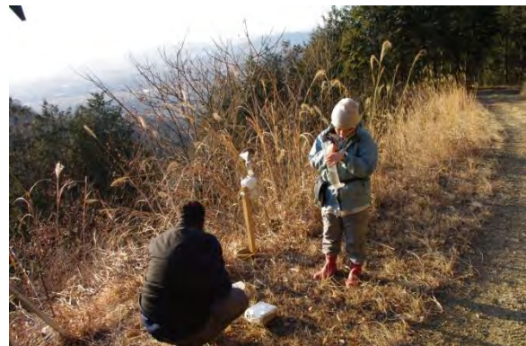
林外雨サンプリング