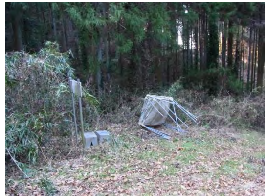
機材仮置き場。林道脇のオープンスペース

午後 KS24 サンプル回収、メンテナンス、テンシオメータ回収 KS22 サンプル回収