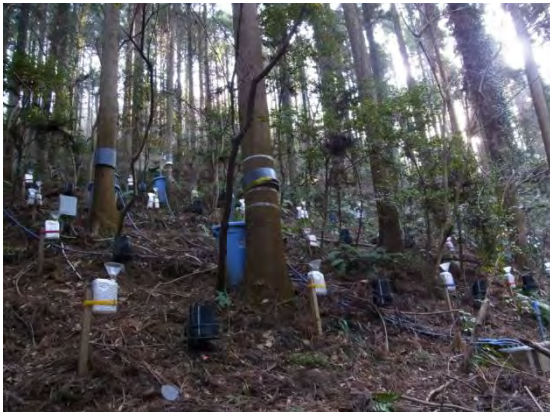
遮断プロット撤去前