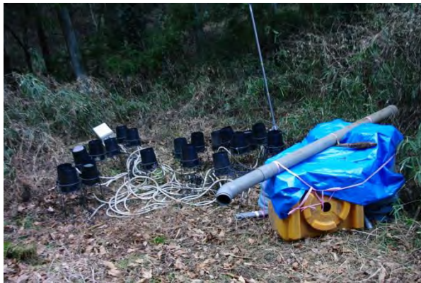
機材仮置き場。林道脇のオープンスペース