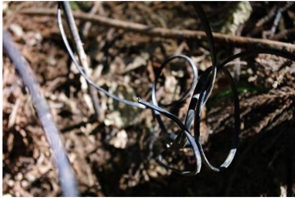
雨量計のコードが切断されていた。 →再設置時に交換