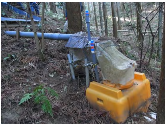
斜面プロット撤去前