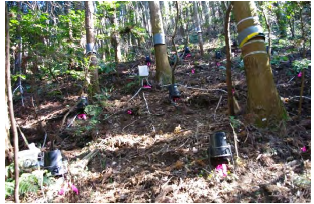
雨量計、雨水サンプラー、owl ロガーの位置は、ペグとピンクテープでマーキング。