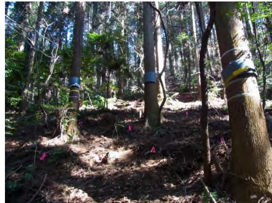
遮断プロット撤去後