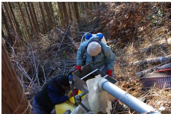
KS22 斜面プロット タンクの洗浄

午後 KS24 サンプル回収、メンテナンス、テンシオメータ回収 KS22 サンプル回収