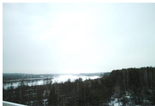
写真 2 放射性 Sr によって汚染されたプリピャチ川の周辺

車により 15 分程度移動し、職員の方々のミーティングルームや食堂のある事務所へと到着した。ここで、職員の方々が現在取り組んでいる研究や、近くにある建物の役割などに関する説明を受けた。その後、事務所内で昼食を頂いた。この時、正確な数までは把握をしていないが、大勢の職員の方々が今もなお居住禁止区域内で働いていることに驚いた。現在日本でも、福島第一原子力発電所近傍の居住禁止区域内で、多くの方が除染作業に従事しているが、今後長期間除染を続けていく上でこのような複合施設の重要性を感じた。