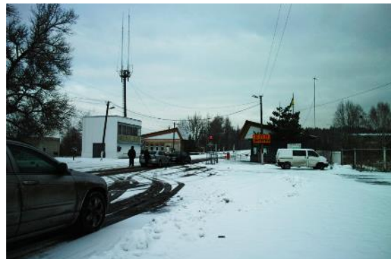
写真 1 居住禁止区域入口の検問所の様子