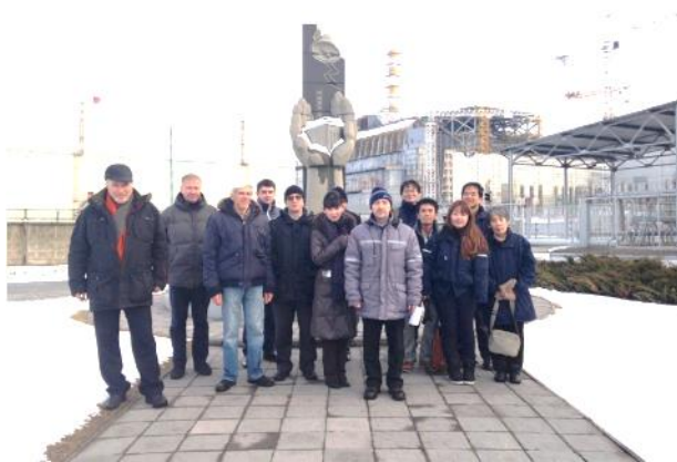
写真 8 モニュメントの前での集合写真

今回の訪問を通して、チェルノブイリの現状だけでなく、福島とチェルノブイリでの放射性核種の挙動の違いなどについて理解を深めることができた。日本とウクライナ、事故の起こった時期は違うが共に連携をしていくことで、この難題にも立ち向かうことができるのではないかと感じた五日間であった。