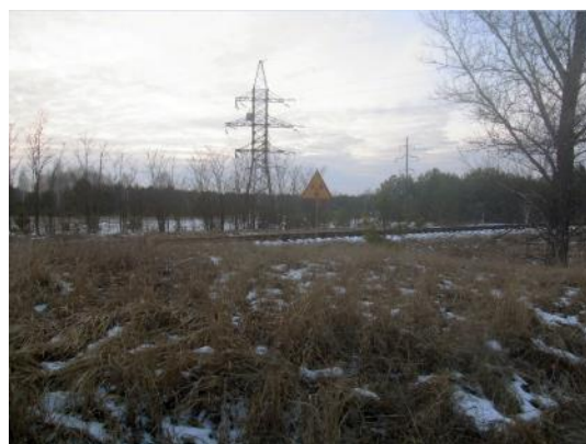
写真 7 立ち入り禁止の標識の立つ「赤い森」