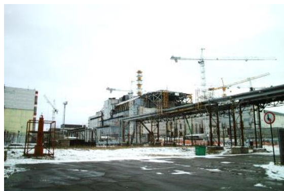
写真 5 建造中のシェルターとメルトダウンを起こした 4 号炉

次の目的地に移動するために再び車に乗り込んだが、車の窓から景色を見てみると立ち入り禁止の標識があちこちに立っていることに気が付いた。職員の方によると、道路付近は大体的に除染されたが少し離れた場所ではまだ放射性核種が残存しているとのことであった。日本でも、現在大々的な除染作業により避難区域全体での線量率は下がっているが、局所的な汚染は未だに残存している。このように、広範囲の除染は困難であることから、その問題を解決するために我々研究者が一丸となって取り組むべきであると考えられる。