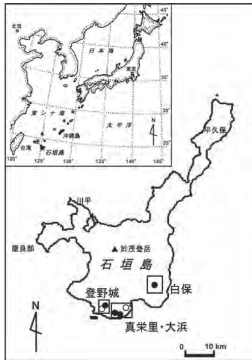
第 1 図 石垣島の位置と津波石の分布 (○印は台座をもつ津波石、●印は台座をもたない津波石を示す)

石垣島周辺には過去数千年間において、数回の大津波が襲来した（河名・中田，1994）。有史以来で最も大きな津波の 1 つは 1771 年の明和津波で、約 12,000 人の犠牲者を出し未曾有の災害をもたらした。津波によりサンゴ礁の礁縁（リーフエッジ）が破壊され、それが打ち上げられて定置した津波石の場合は、それに含まれるサンゴ化石の中で最も新しい年代を津波の発生した時期と考えることができる。河名・中田（1994）は、宮古諸島から石垣島など八重山諸島全域における総計 65 個の津波石の ^{14}\text{C} 年代値（未較正值）に基づき、1771 年明和津波以前の大津波の時期を、約 500 年前、約 600 年前、約 1100 年前、約 2000 年前、約 2400 年前、約 3750 年前、約 4350 年前および