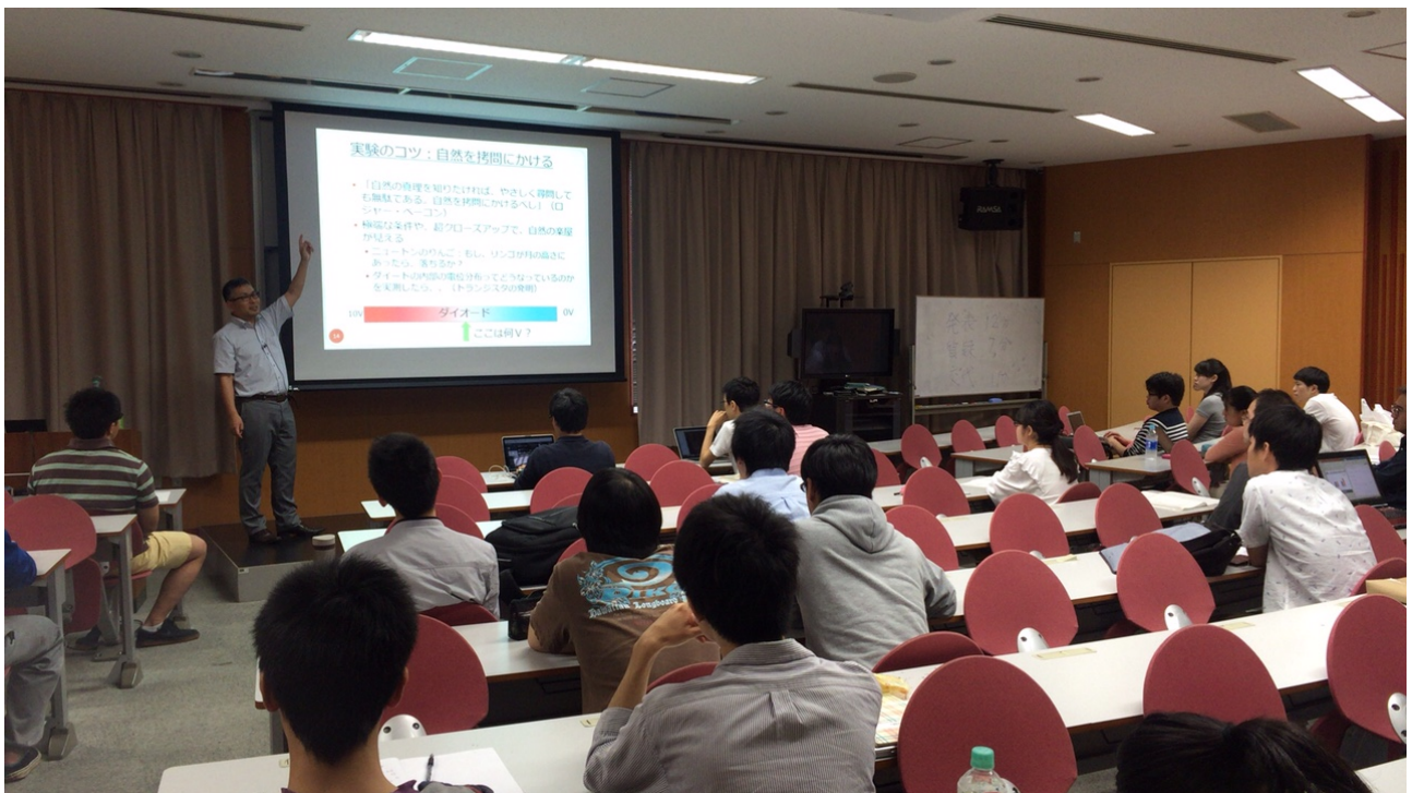
写真 2: 産総研・中田亨氏による研究企画と論文作成に関する講演会