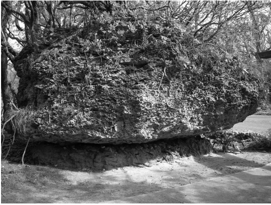
第2図 末吉神社の鳥居脇の巨礫と台座岩：台座岩の高さが地表面低下量（石灰岩溶解量）を示すと考えられる

どであった。前述した石灰岩の台座岩の例では、その上に載る岩石は溶解し難い岩質からなる迷子石であることが多い。しかし、喜界島のこのケースは、台座岩およびそれを保護している帽岩（cap rock）とともに溶解しやすい石灰岩から構成されるという特徴をもつ。台座岩周辺の地表には厚さ数cmの砂層があり、その下は台座岩と同じ岩相をもつ石灰岩の基盤となっている。